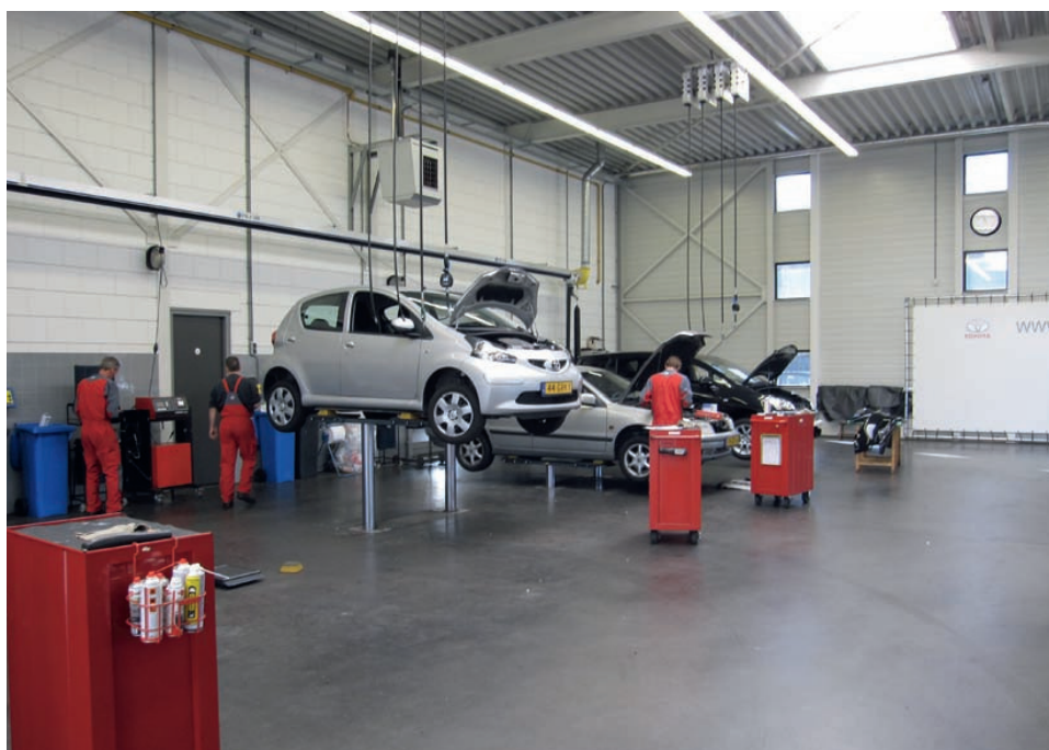
Een flink aantal garagebedrijven en een aantal ROC's heeft de training 'De Veilige Werkplaats' inmiddels gevolgd

Nu de aanvragen van de cursus blijven binnenstromen, dringt de vraag zich op