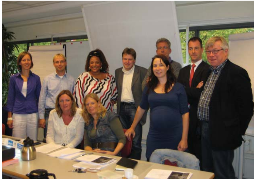
De leden van de project- en stuurgroep arbocatalogus in de sport, 29 september 2009.

Toen ben ik ook eens gaan kijken naar het aantal kilometers dat onze medewerkers vanuit Zeist en alle districten jaarlijks rijden. Dat bleek om 2,6 miljoen zakelijke kilometers te gaan! Pas toen ben ik me samen met de directie echt bewust geworden van het belang van het onderwerp vervoer. Het verraste me dat we daar als KNVB niet eerder bij stil hadden gestaan. Ook verwonder ik me nog steeds over de praktische oplossingen die we in de arbocatalogus aanreiken. Dat we het van niets hebben gebracht tot wat er nu ligt, is om trots op te zijn. Ik ben ervan overtuigd dat heel veel bedrijven in de BV Nederland hier veel aan kunnen hebben.'